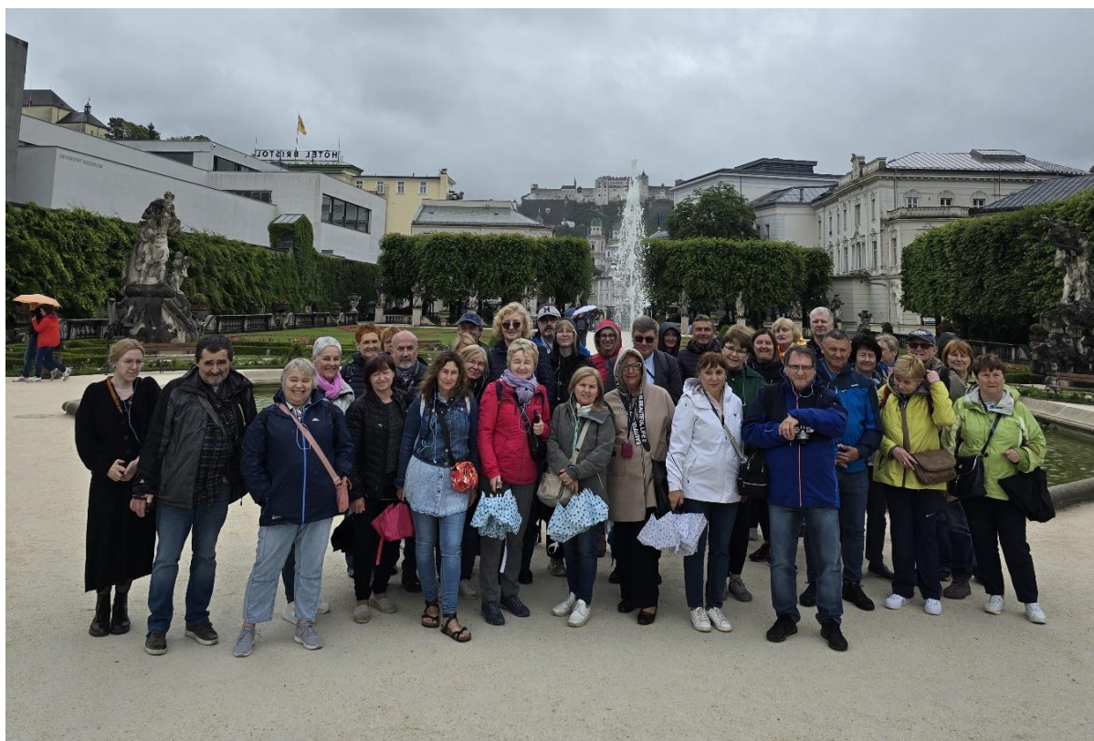
Uczestnicy wycieczki do Czech i Austrii

Pełni wrażeń wróciliśmy późną nocą do domu, planując już kolejny wyjazd, na który zapraszamy. Informacje tuż po wakacjach!