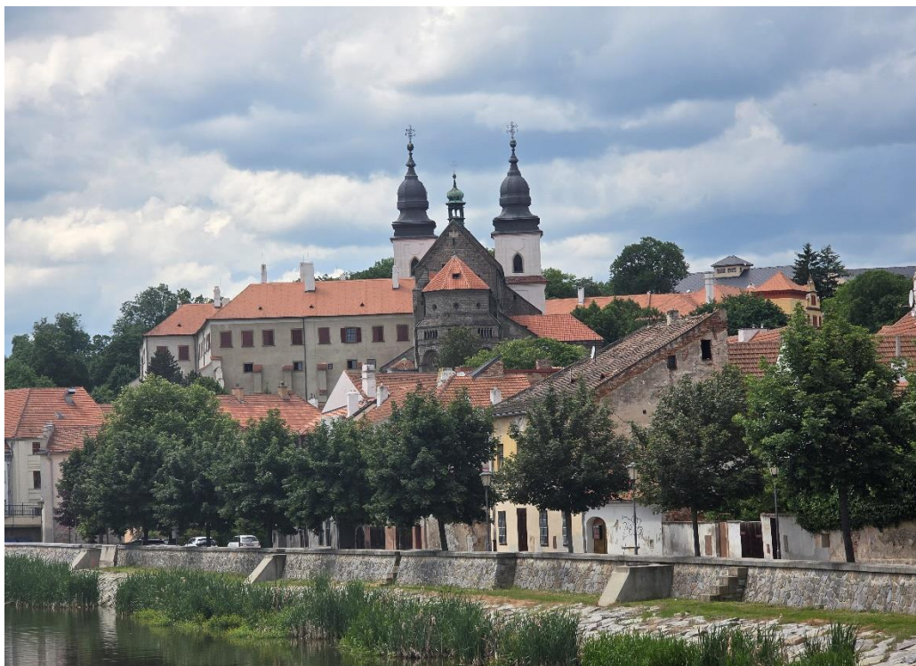
Bazylika św. Prokopa w Trzebiczu